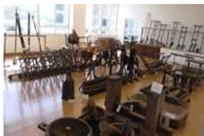
（各見学場所では熱心に説明を聞きながら展示物を見学していました）