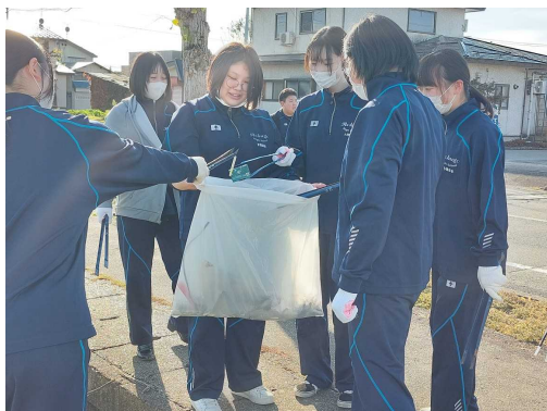
地域清掃ボランティア

1年生は進路に関わる行事が多く、見学や県内企業の紹介を通して、自分がどんな仕事に就きたいのかを考える機会となりました。3年生は卒業後を見据えたマナーや年金制度を学ぶ機会となりました。2年生同様、充実した日々を過ごしていました。