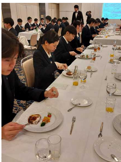
テーブルマナー講習会